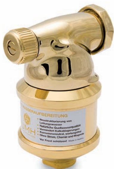
UMH COMFORT SERIE

Garantiedetails finden Sie auf: www.umh-umwelttechnologien.at/garantie.html